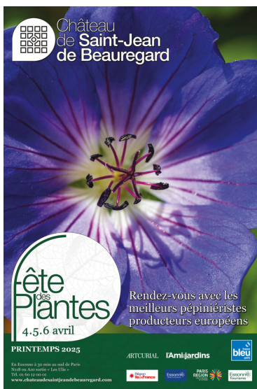
Fête des plantes de printemps 4, 5 et 6 avril - les plantes couvre-sol