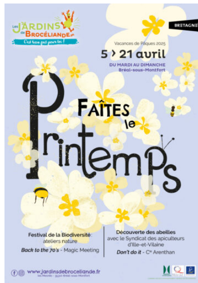
Faites le Printemps