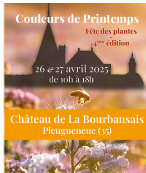
Couleurs de Printemps