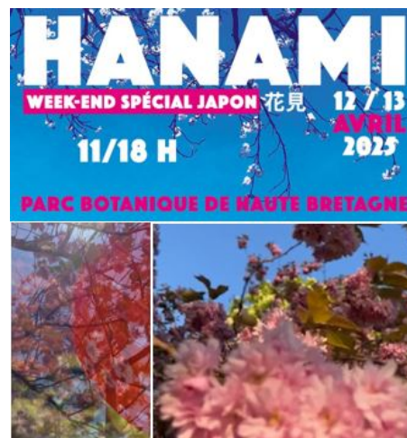
Hanami - weekend spécial Japon

Jardin exotique et botanique de Roscoff (29)