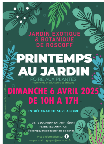
Printemps au jardin