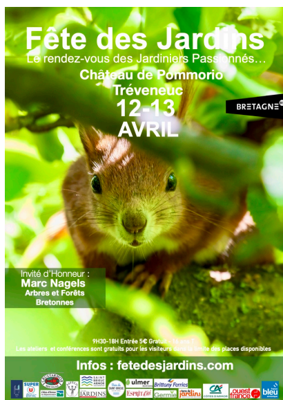
Fête des Jardins